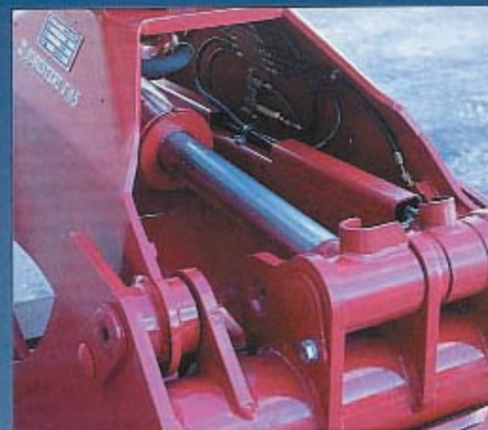
Die neuen Greifer F38 und F45 können mit Zentralschmierungssystem ausgerüstet werden.