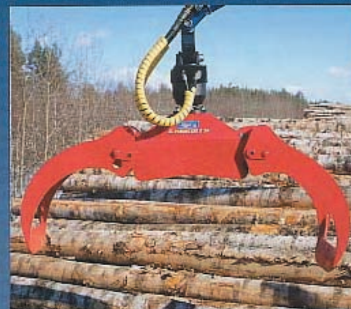
Die Konstruktion der Greiferbacken erleichtert das Aufnehmen der Stämme aus dem Stapel. Das Sortieren des Holzes ist damit einfach.